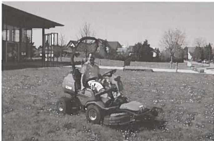
Romeo Eppinger freut sich über sein neues Arbeitsgerät

Die Maschinenflotte des städtischen Bauhofes wurde um einen neuen Frontmäher erweitert. Für die Neuanschaffung des Gerätes wurden rund 15.500 Euro aufgewendet. Mit einer Schnittbreite von 1,22 m kommt der kompakte und durch eine Servolenkung sehr agile Mäher auf allen Grünflächen in den Rheinauer Ortschaften zum Einsatz.