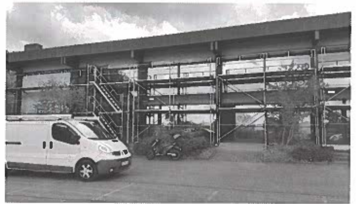
Fassadenarbeiten an der Hans-Weber-Halle in Linx