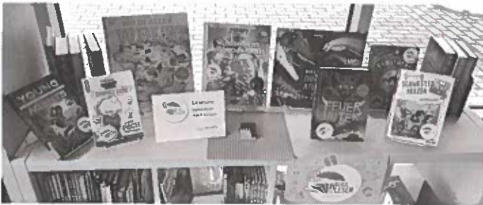
Heiß auf Lesen in der Stadtbibliothek Rheinau

Dazu gibt es weitere tolle Preise zu gewinnen. Denn auch in diesem Jahr können zusätzlich bei der Sonderverlosung des Regierungspräsidiums Freiburg, Fachstelle für öffentliches Bibliothekswesen, welches als koordinierende Stelle fungiert, attraktive Preise ergattert werden.