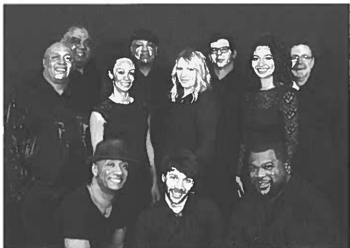
Pop and Soul

Die Möglichkeit eines Antigentests wird am Samstag zwischen 9:30 und 11:30 in der Stadthalle Freistett angeboten und Termine sind unter www.rheinau.de buchbar.